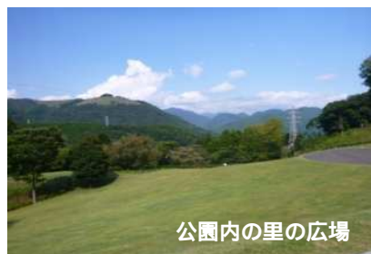
公園内の里の広場