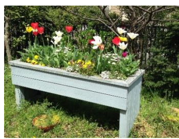
第3回レイズドベッド