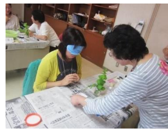
第6回ロールプレイ