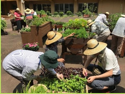
園芸療法活動の様子

植物は人の心を癒し、穏やかにし、和ませる力があり、 園芸作業は人の心や身体を前向きに能動的にする力があります。 植物や園芸作業を活用するリハビリテーションとしての“園芸療法”。 その考え方や手法を取り入れて、自分の中に種をまき、 地域の中でボランティアとして活躍しませんか？