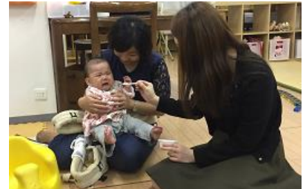
人材育成 子育てと仕事両立体験研修事業