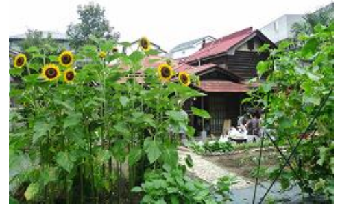
空き家等の利活用による地域の魅力アップ事業

※ 年度ごとに審査があります。また、4年目以降（最長5年間）の継続を求める場合は、別途事業計画（自立計画）の提出が必要です。