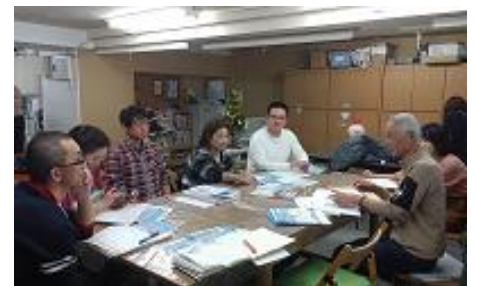
プロボノ・プラットフォーム構築事業

● 支援の対象となるボランティア団体は、事業受託者が公募、選定を行い、県の承認を得て決定します。