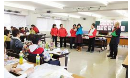
女性ならではの視点を活かした防災啓発活動