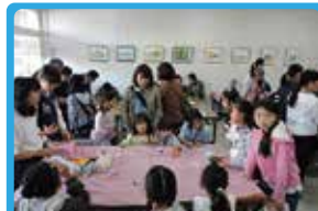
千本桜商店会 こども文化祭の運営