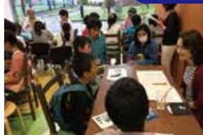
団体とお見合い会