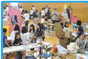
一色大滝商店会 こどものまちははじめて開催