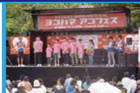
ヨコハマアコフェス 神奈川子ども未来ファンドのPR