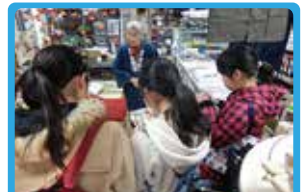
本牧リボンファンストリート 本牧リボンタイムズ作成

【問合せ】 NPO法人ミニシティ・プラス 045(306)9004 minicityplus@gmail.com