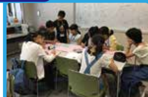
かなりあ少年少女合唱団 コンサートの企画&PV作成