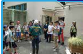
NPO法人野生動物救護獣医師協会神奈川支部 野生動物保護キャンペーン