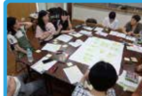
NPO法人横浜プランナーズネットワーク 空き屋の活用を検討