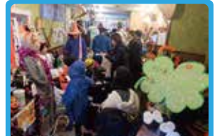
ハッピーサークル ハロウィンイベント