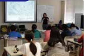
まちづくりのいろは講座

特命子ども地域アクタープロジェクトの一部は、よこはま夢ファンドを通して、株式会社FREEingに依頼していただいています。