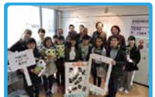
川崎市まちづくり局景観担当 #宮前坂道 フォトコン