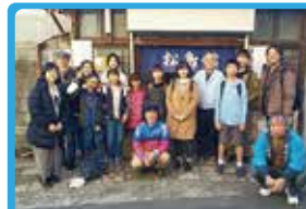
戸部大通り商店会 戸部大通りこども朝市