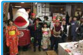
株式会社三浦海業公社 三崎のウォークラリー企画実施