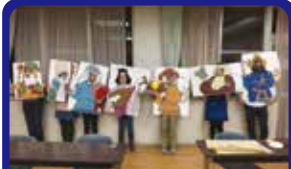
横浜市中川西地区センター スマホまちあるきイベント企画実施