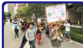
ハッピーサークル ハロウィンパレード企画、実施