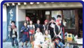
株式会社三浦海業公社 三崎のウォークラリー企画実施