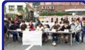
湯河原駅前通り明店街 朝市でクイズ大会と子どもアルバイト実施