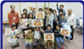
NPO法人かながわ311ネットワーク 防災プログラムの検証、啓発イベント実施