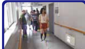
かながわブライндスキークラブ 視覚障害者を知る体験イベントに参加