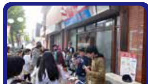
鋼管通商栄会 アツツツ交換イベントを開催