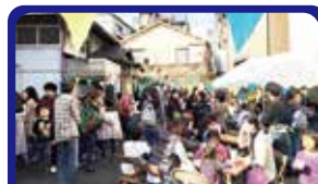
戸部大通り商店会 子どもたち朝市開催。テーマ曲作成