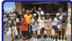
寒川駅北口商店会 商店街マップづくりのためのまちあるき