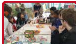
松田町国際交流イベント(足柄)