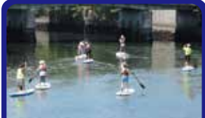
NPO法人海の森・山の森事務局 大岡川清掃に参加、体験レポート