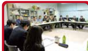
防災訓練子ども参画(都筑区)

こどものまちづくり応援事業は、かながわ生き生き市民基金による、多くのみなさまの寄付をいただき、実施することができました!