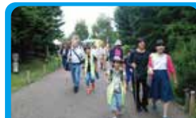
かながわブラインドスキークラブ 視覚障害の方達とのまちあるきとマニュアルづくり