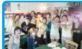
ホットシェフ 商店街のプロモーションビデオ撮影