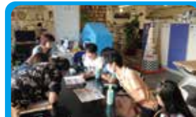
公財)神奈川フィルハーモニー管弦楽団 プロモーションのためのかなフィルLINEスタンプづくり