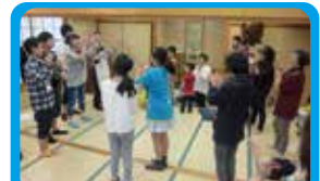
ハッピーサークル テーマ曲づくりとダンスでのイベント盛り上げ