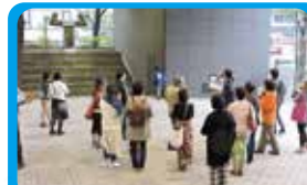
横浜都筑文化プロジェクト 横浜北部エリアの文化的魅力を研究