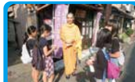
NPO法人夢キューブ ハロウィンイベントの企画とプロモーションビデオ撮影