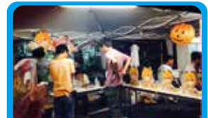
湯河原駅前通り明店街 商店街のキャラクターをPRする商品の試作販売