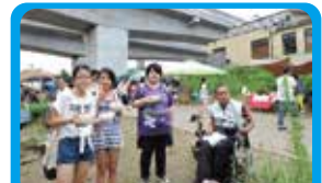
NPO法人横浜移動サービス協議会 バリアフリーマップづくりをこどもたちと