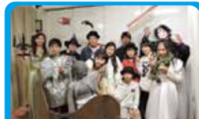
NPO法人街カフェ大倉山ミエル 商店街の歴史を認識してもらうイベント企画