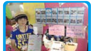
NPO法人横浜コミュニティデザイン・ラボ 環境イベントに来たことまへのブース企画