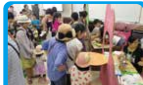
ほどがや子どもニコニコフェスタ 子どもが主体となるイベントの運営