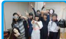
横浜市中川西地区センター 新しい事業寺子屋のPRイベント企画