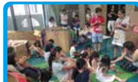
フォーラム・アソシエ 子どもが主体となるイベントの運営