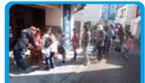
株)三浦海業公社 三崎のまちの魅力を伝えるウォークラリー