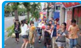
鋼管通商栄会 アツアツ交換の商店街イベントを定着させる