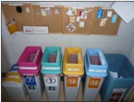
事務所内の廃棄物の見本（写真上部）