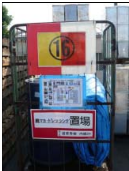
動植物性残渣 (マヨネーズ、ドレッシング置場)

分別排出については、工場内の環境整備・教育等による意識向上の結果、かなり進みましたが、さらに分別の徹底に取り組んでいきます。