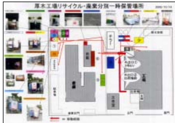
分別排出と一時保管場所の指導