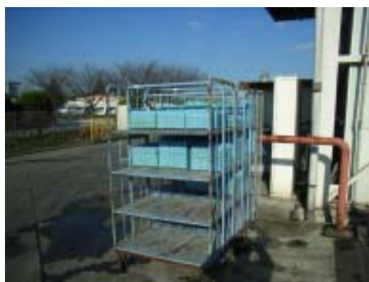
折畳んだタマゴの通い函 (返却時)