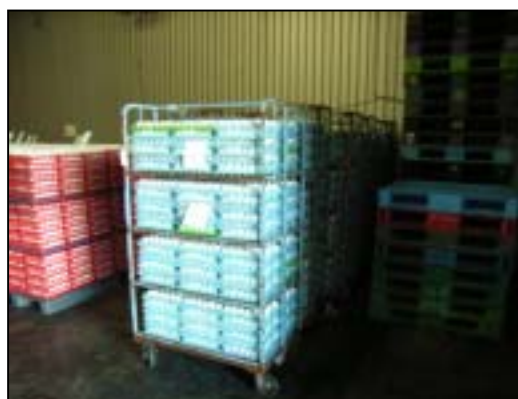
タマゴの通い函 (入庫時)