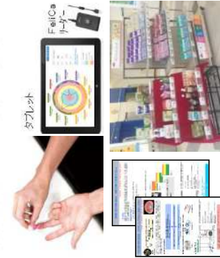
トクホ・サブりに案内 外来誘導