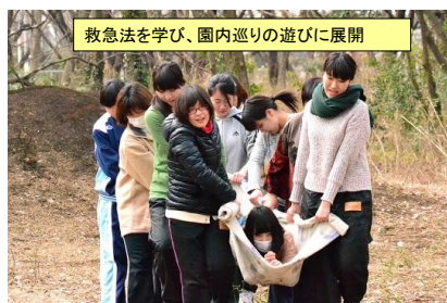
救急法を学び、園内巡りの遊びに展開