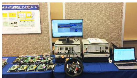
TEST BET Evaluation

NEC 向けのスパコンや富士電機の PLC など幅広い分野で培った技術を活かし、ハード・ソフト開発からファブレス形態での製品製造まで事業領域を拡大している企業。2017 年から科学技術イノベーション分野のプロジェクトにも携わり、セキュリティアプリケーションの検証開発等を行っている。