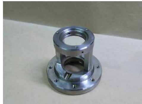
縦型マシニング4軸（インデックス）付での加工

創業以来一貫して、自動車部品、食料品製造機械部品、生産加工設備機械部品のフライス加工を行っている企業。特に、自動車関連のレース用エンジン部品などの難加工部品を得意とし、短納期に対応した小回り性、コスト競争力、汎用フライス加工機を使用した技能が高く評価されている。