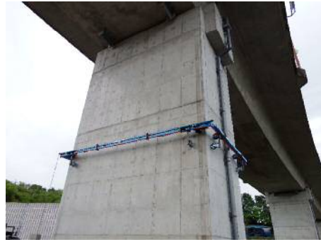
橋脚点検ロボット「のぼるくん」

培った機械加工技術の知見を活かし、部品加工のみならずオーダーメイドのインフラ点検用ロボット・機械・特殊治具の設計・製造を行う「課題解決型のエンジニアリング集団」。匠の技術と「工業の宮大工」の加工ネットワークで大物・難加工物でもワンストップで解決している。