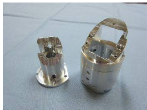
アルミ複合切削部品

樹脂・金属の切削加工を手掛ける試作加工を行っている企業。「切削加工の限界に挑戦」をモットーに難形状、難削材や新素材にも果敢に取り組み続け、「加工の駆け込み寺」と呼ばれるほどである。創業40周年を迎え、社員5名の小さな町工場にも関わらず、今や大手メーカーとも直接取引をし、研究開発に携わっている。