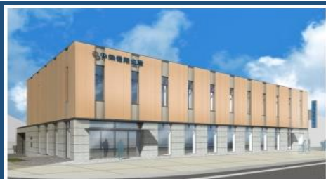
秦野駅前支店 なかしんホール ( 秦野市尾尻 943-1 )