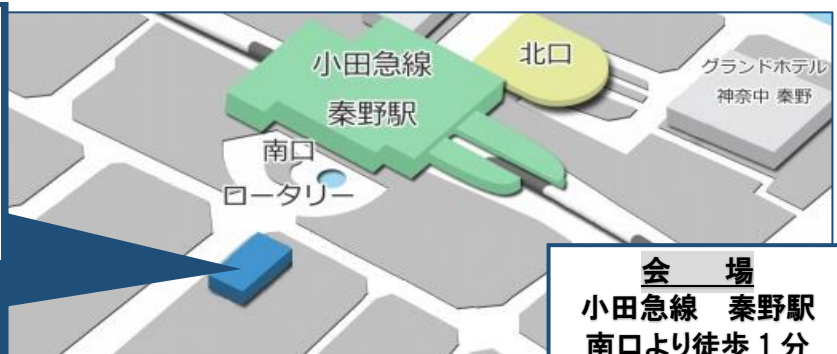
会 場 小田急線 秦野駅 南口より徒歩 1分