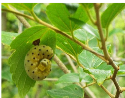
ホシアシブトハバチの幼虫