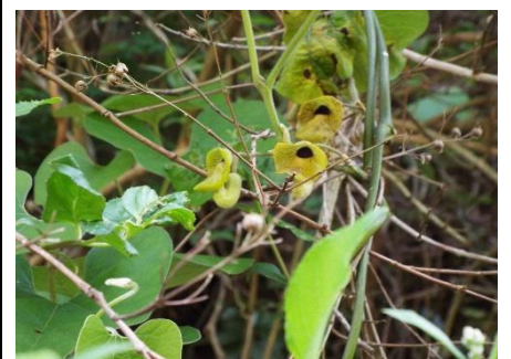
オオバウマノスズクサ