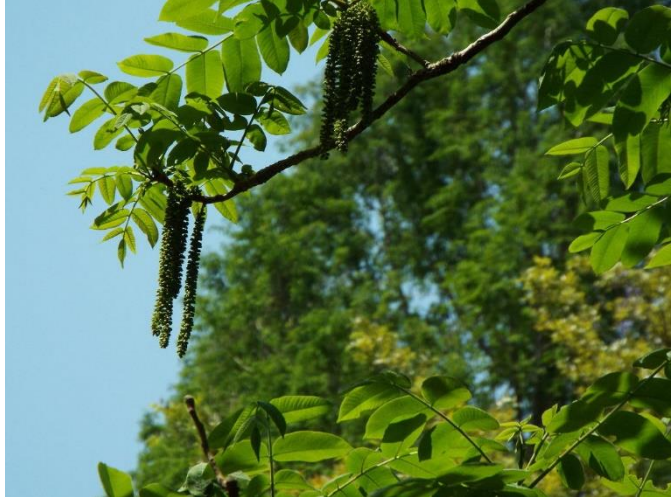
オニグルミの雄花

春を飛び越えて、初夏を感じさせる谷戸でした。昔から日本では緑(あお色)の呼び方がいろいろあるように緑にも色々な色調があるのを実感する谷戸でした。この緑の中でナガサキアゲハ、ジャコウアゲハやアオスジアゲハが谷戸に舞う姿を観察しました。シュレーゲルアオガエルの鳴き声が響き、またコゲラのドラミングやキビタキ、シジウカラのさえずりが響き、いのちが踊りだす春の谷戸でした。