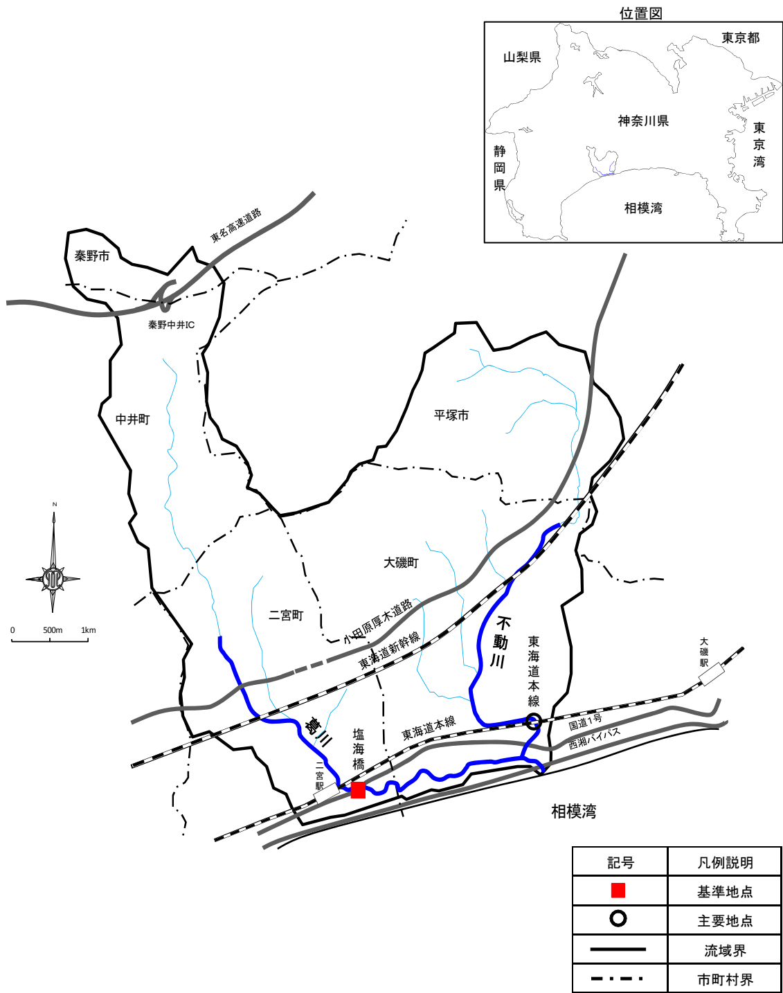
<参考図> 葛川水系流域概要図