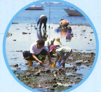
走水の潮干狩り Clam digging at Hashirimizu MAP K-8