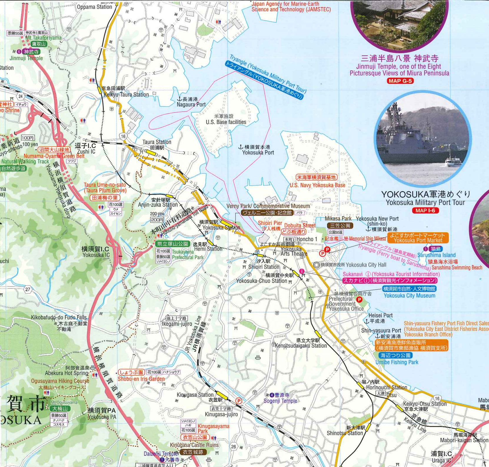
三浦半島八景 神武寺 Jinmuji Temple, one of the Eight Picturesque Views of Miura Peninsula MAP G-5