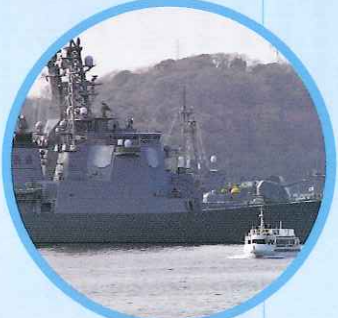
YOKOSUKA軍港めぐり Yokosuka Military Port Tour MAP I-6