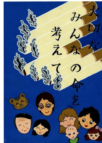
平成 26 年度特選作品