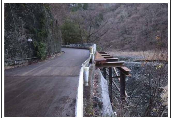
【7月6日崩落箇所：仮橋設置】