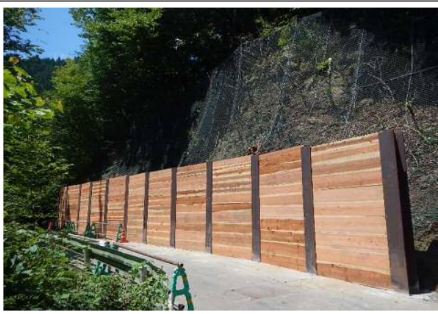
【6月25日崩落箇所：仮設防護柵設置】