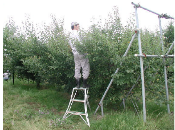
図2 脚立を利用した収穫作業(X字形)