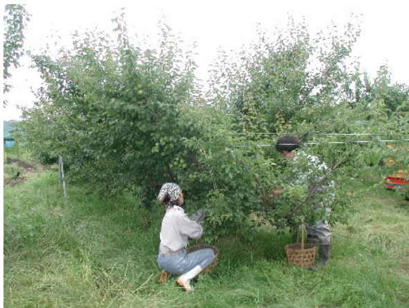
図1 一文字低樹高仕立ての収穫作業

安全性と収穫作業の省力化を目的とした、ウメの低樹高栽培は、木の高さを3 mまでに抑えて主枝を横へ広がらせるため、脚立などをほとんど利用しないで収穫ができます。収穫作業の効率も高く、1時間あたり1人で約60kg収穫でき、普通の栽培よりも20~30kg多く収穫できます。