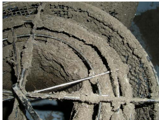
写真2 網カゴに付着したMAP