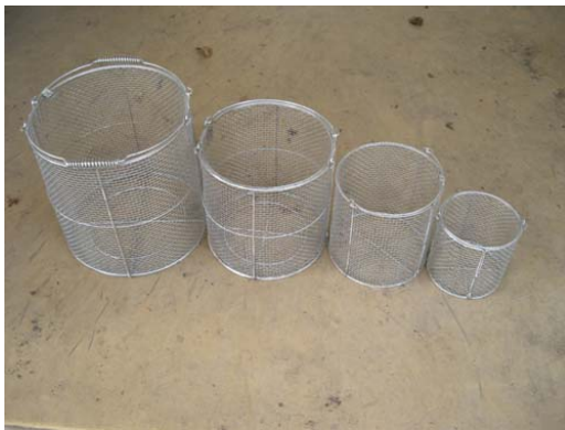
写真1 直径の異なる網カゴの様子