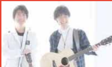
横浜を中心に 活躍中! フォークデュオ 「N.U.(エヌユー)」