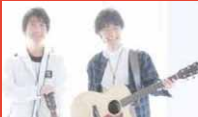
横浜を中心に 活躍中! フォークデュオ 「N.U.(エヌユー)」