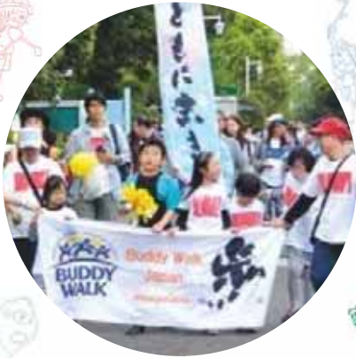
※写真：パディウォーク in ヨコハマ 2017

There are no strangers, only friends we have not met yet.