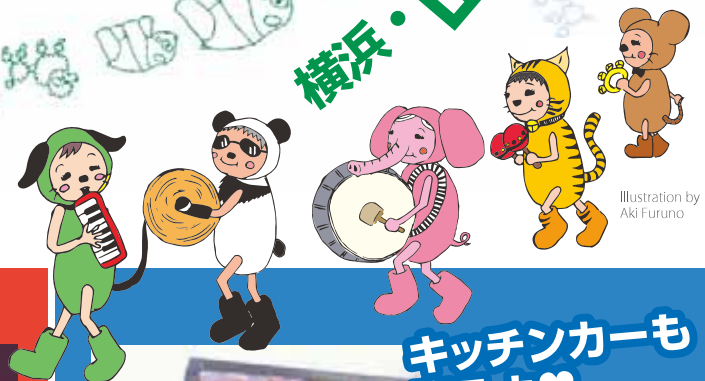
Illustration by Aki Furuno